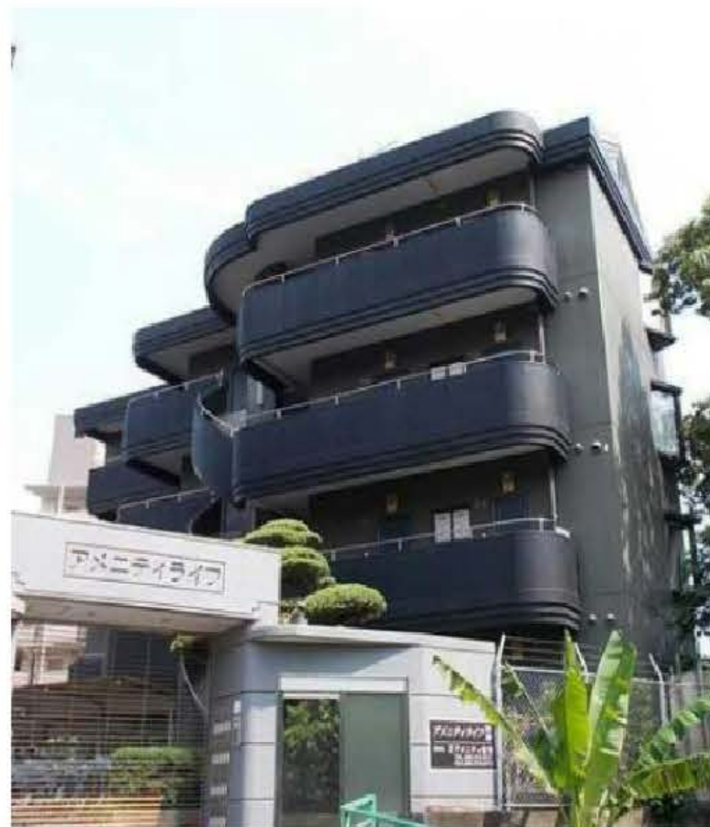
アメニティライフ90の外観