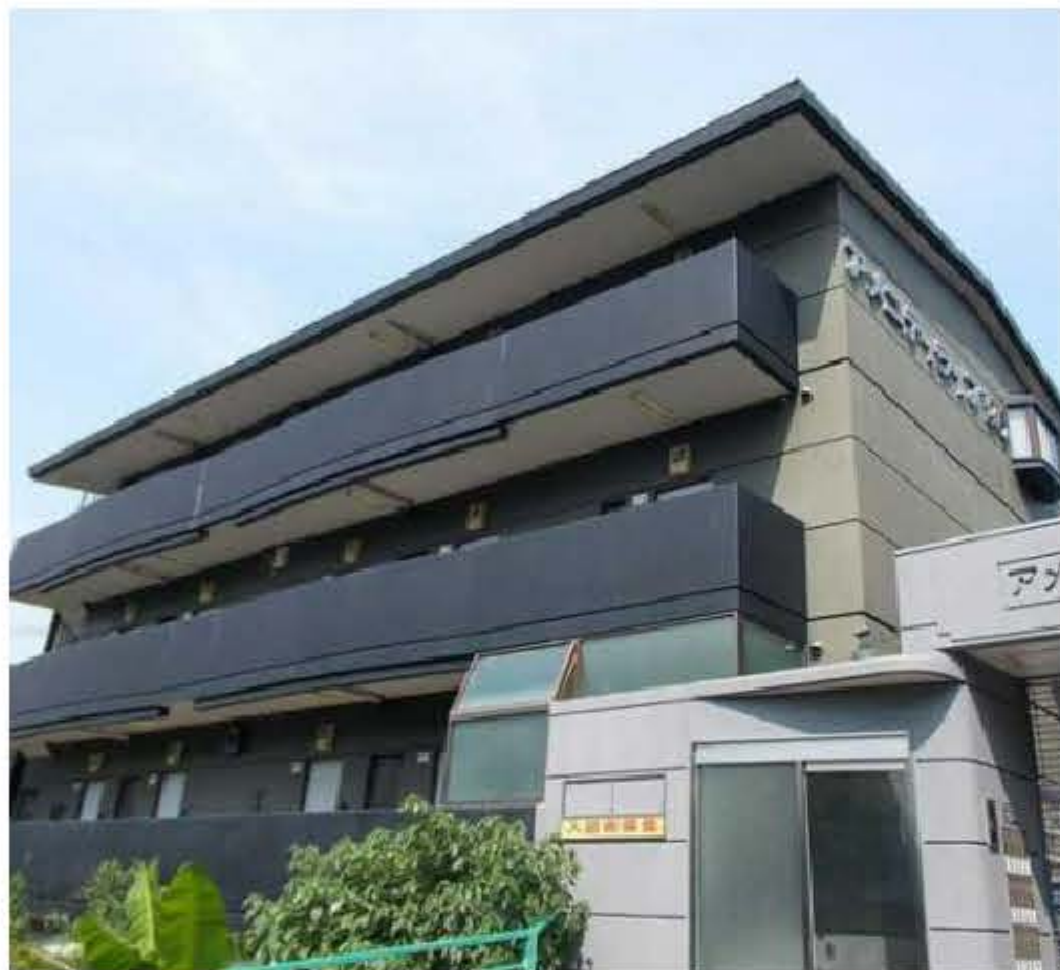
アメニティライフ96の外観